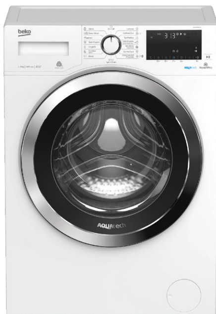
*Imaginea produsului este cu titlu de prezentare