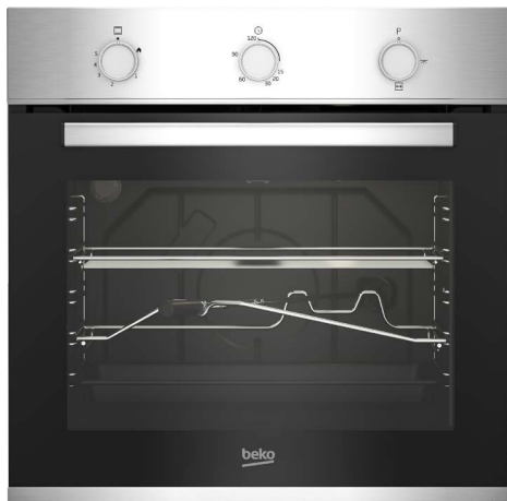
*Imaginea produsului este cu titlu de prezentare